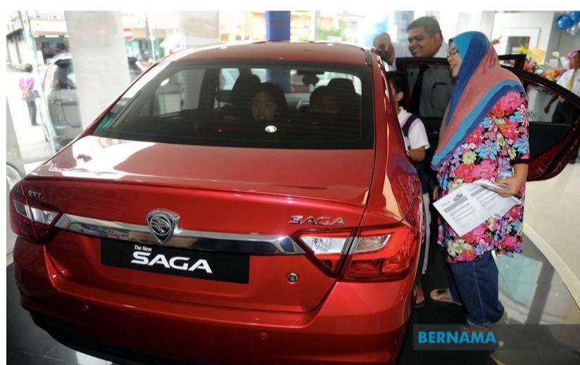
Proton jual 9,440 unit pada Mei